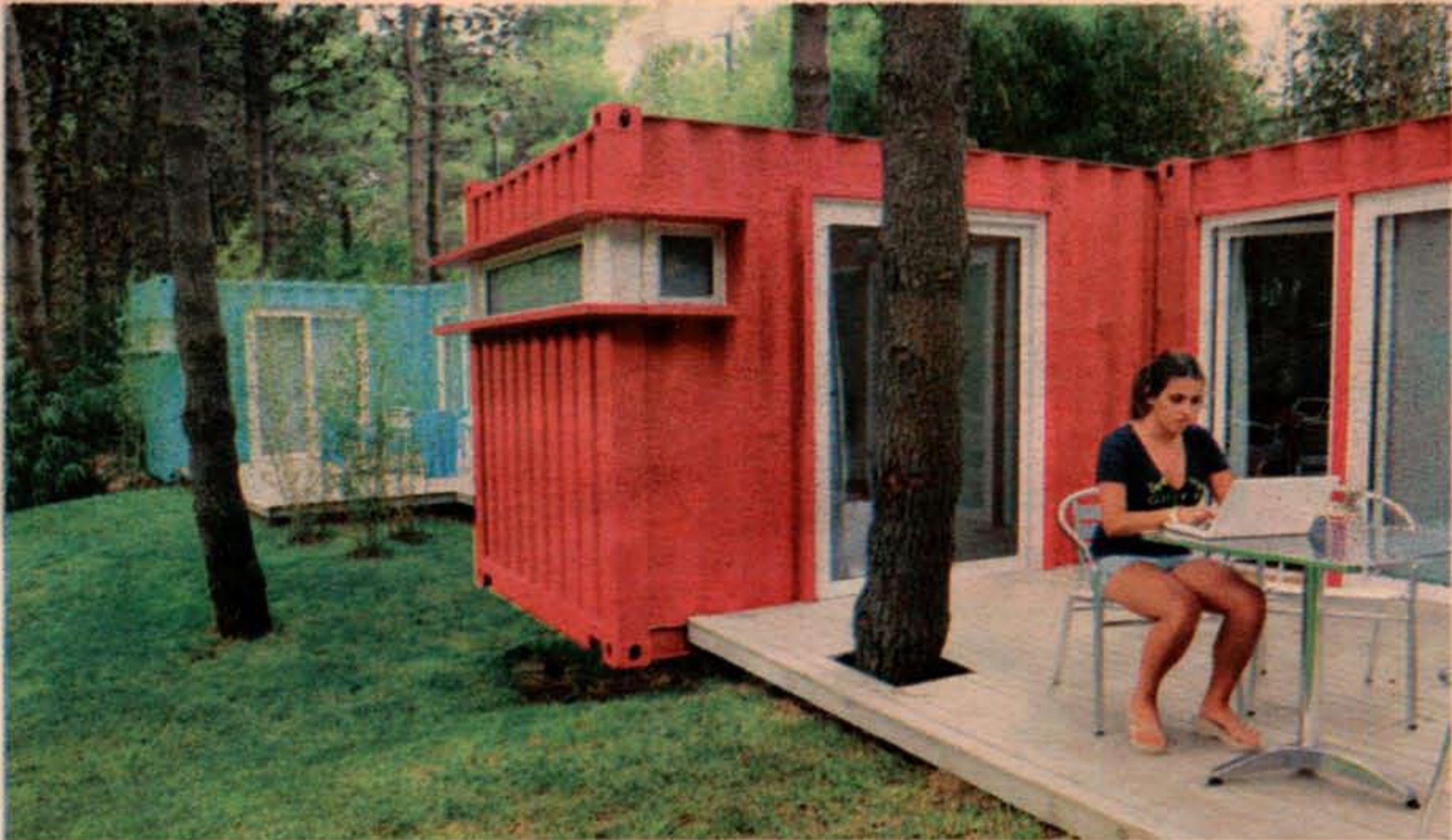
LOS CONTENEDORES DEL GLAMPING FUERON TRANSFORMADOS EN CÓMODOS DEPARTAMENTOS PARA LOS TURISTAS EN PINAMAR.

Es un nuevo concepto en los bosques de Pinamar. Se lo conoce como glamping y ofrece comodidades exclusivas al turista.